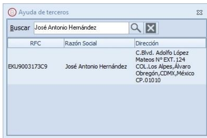
Figura 3. Ayuda de terceros