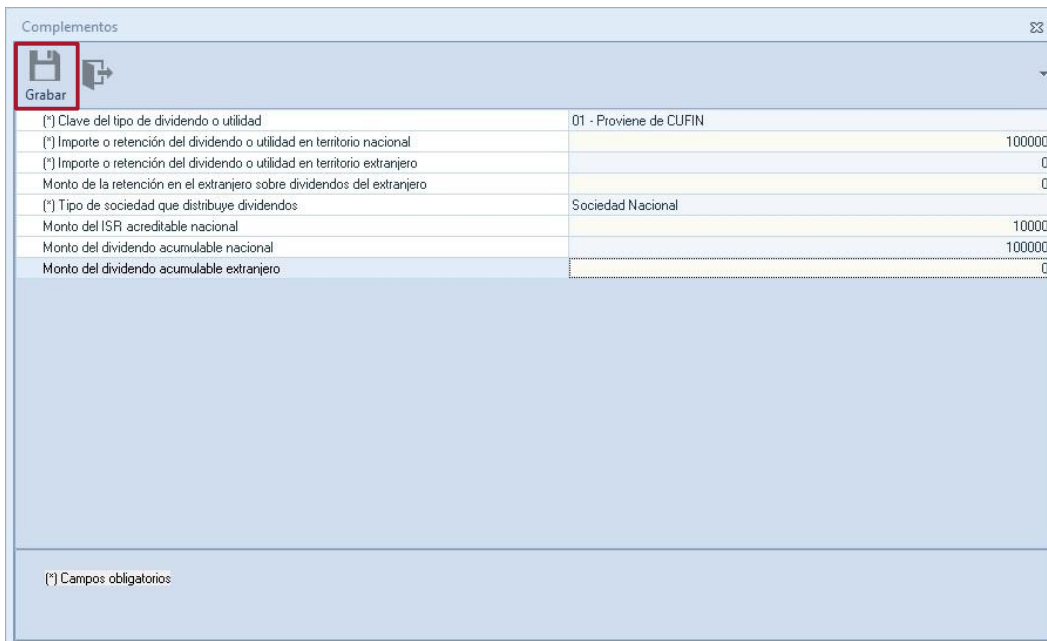
Figura 5. Llenado del complemento

Una vez capturados los datos da clic en Grabar .